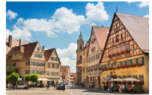
★ Dinkelsbühl / Romantische Strasse ★