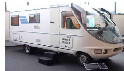
★ Erwin Hymer Museum ★ (Die Welt des mobilen Reisens)