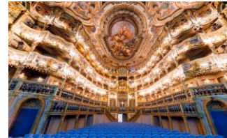
★ UNESCO Weltkulturerbe ★ Opernhaus Bayreuth