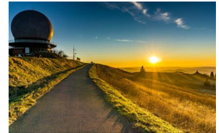
★ Radom Wasserkuppe ★ (Ein Relikt aus dem kalten Krieg)