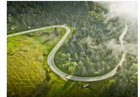
★ Schwarzwaldhochstrasse ★

Auf Traumstrassen durch Bayern und Baden-Württemberg