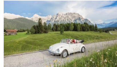
★ Bayerische Alpenstrasse ★