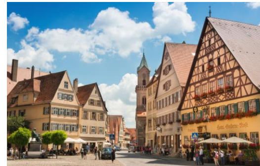
★ Dinkelsbühl / Romantische Strasse ★

Auf Traumstrassen durch Bayern und Baden-Württemberg